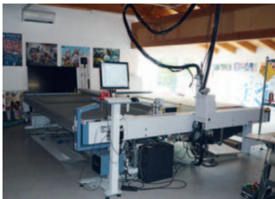
Der 3XL-3000-Digital-Cutter von Zünd wird mit i-Cut-Schneidemarken aus dem RIP gesteuert.

Künftig will er allerdings noch ein paar weitere Neuerungen einführen, etwa die ebenfalls unterstützte JDF-Kommunikation. Auch eine Anbindung der Kalkulation und Medienverwaltung sowie der Rechnungslegung mit EFI Printsmith stehen demnächst an. »Rationalisierung und