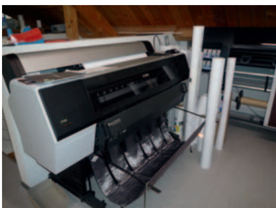
Auch der Epson Stylus Pro 9900 für Proofs und Fotodrucke wird mit EFI Colorproof XF angesteuert.