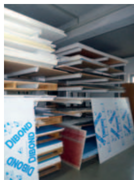
Blick in das Plattenlager von Ulrich Studios.